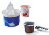
les pots en plastique