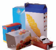
les boîtes et les suremballages en carton