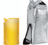
les emballages souples (sachets fraîcheur)