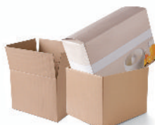
les cartons volumineux