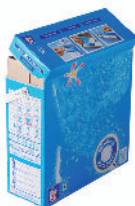
les barils en carton