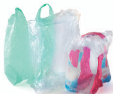
les sacs plastiques