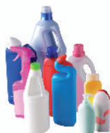
les emballages opaques

(les bouteilles de produits ménagers, les flacons de produits d'hygiène, les bouteilles et boîtes en plastique opaque et les cubitainers)