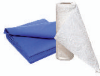
les papiers absorbants (serviettes, mouchoirs, etc.)