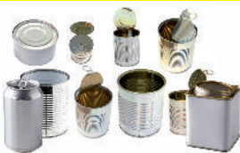
les boîtes et les canettes