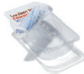
les barquettes en plastique transparent, et les suremballages