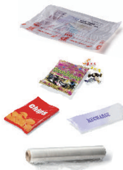
les films plastiques et sachets

Les "nouveaux" emballages que vous devez mettre dans le bac BIFLUX