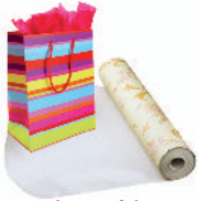
les papiers spéciaux (papier peint, papier cadeau, papier calque et papier teinté)