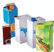
les briques alimentaires